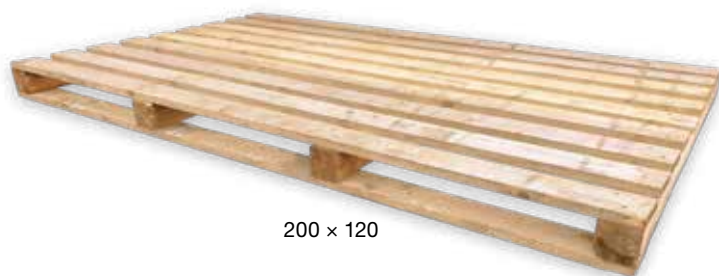
200 × 120

UPOZORNĚNÍ: atypické palety o rozměrech 200 × 120 cm se vykupují zpět pouze v bezvadném stavu.