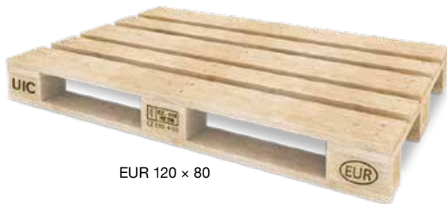
EUR 120 × 80

V tabulce jsou uvedeny výkupní ceny bezvadných palet.