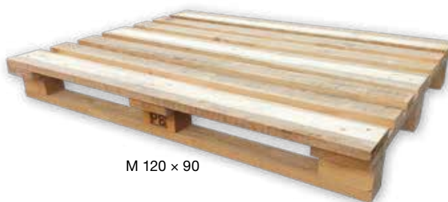
M 120 × 90

Kupující má právo vrátit nebo vyměnit (při další dodávce na započtení ceny palet této dodávky) prodávajícímu palety stejného druhu, nepoškozené a k dalším expedicím použitelné, a to do 6 měsíců ode dne dodávky, pokud není smluvně stanoveno jinak. Podmínkou pro zpětný výkup/odběr palet je jejich bezvadný stav v souladu s požadavky norem UIC435 – 2 a ČSN 269110, případně také s technickou dokumentací palet PRESBETON. Při vracení palet je nutné předložit doklady (uvést čísla dodacího listu, faktury, případně daňového dokladu), ke kterým se dané obaly vztahují. Bez těchto údajů nelze palety odkoupit/převzít od kupujícího zpět. Palety stejného druhu lze prodávajícímu odkoupit/předat jen v místě původní dodávky, pokud není smluvně stanoveno jinak. Dodání palet je považováno za zdanitelné plnění, k uvedeným cenám palet bude