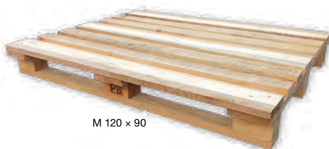
M 120 × 90

Kupující má právo vrátit nebo vyměnit (při další dodávce na započtení ceny palet této dodávky) prodávajícímu palety stejného druhu, nepoškozené a k dalším expedicím použitelné, a to do 6 měsíců ode dne dodávky, pokud není smluvně stanoveno jinak. Podmínkou pro zpětný výkup/odběr palet je jejich bezvadný stav v souladu s požadavky norem UIC435 – 2 a ČSN 269110, případně také s technickou dokumentací palet PRESBETON. Při vracení palet je nutné předložit doklady (uvést čísla dodacího listu, faktury, případně daňového dokladu), ke kterým se dané obaly vztahují. Bez těchto údajů nelze palety odkoupit/převzít od kupujícího zpět. Palety stejného druhu lze prodávajícímu odkoupit/předat jen v místě původní dodávky, pokud není smluvně stanoveno jinak. Dodání palet je považováno za zdanitelné plnění, k uvedeným cenám palet bude