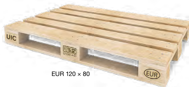
EUR 120 × 80

Do vyčerpání paletového konta, které množstvím či stářím náleží k dodávkám realizovaným dle ceníku platného od 4. 1. 2021 do 30. 6. 2021, resp. od 1. 7. 2021 do 31. 7. 2021, bude výkup realizován za podmínek platných v době vyskladnění palety (200 Kč/ks bez DPH / 242 Kč/ks s DPH; resp. 310 Kč/ks bez DPH / 375,10 Kč/ks s DPH).