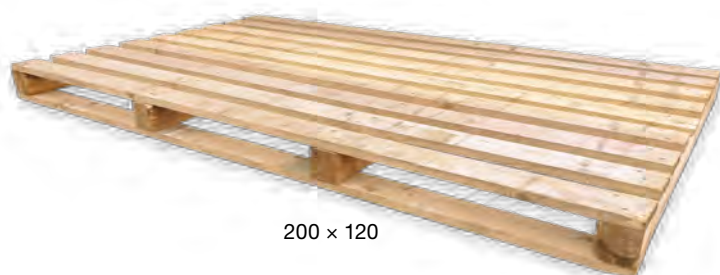
200 × 120

Do vyčerpání paletového konta, které množstvím či stářím náleží k dodávkám realizovaným dle ceníku platného od 4. 1. 2021 do 30. 6. 2021, resp. od 1. 7. 2021 do 31. 7. 2021, bude výkup realizován za podmínek platných v době vyskladnění palety (900 Kč/ks bez DPH / 1 089 Kč/ks s DPH, resp. 1 000 Kč/ks bez DPH / 1 210 Kč/ks s DPH).